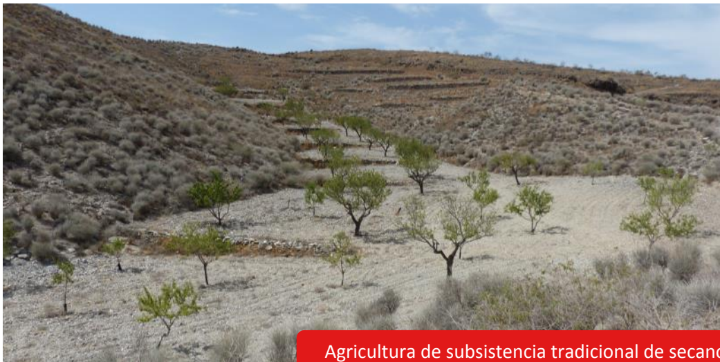
Agricultura de subsistencia tradicional de secano

Entre los años 1950 y 1980, los bancales creados con este tipo de infraestructuras eran labrados principalmente por bestias con arados que difícilmente podían profundizar a más de 10 cm y por los primeros tractores que se conocieron en la zona.