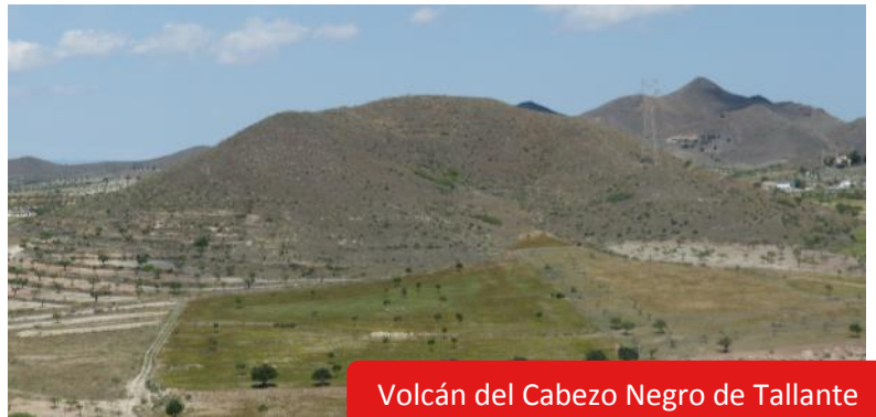
Volcán del Cabezo Negro de Tallante

Uno de los volcanes donde mejor se observan estos procesos, y de los mejor conservados, es el Volcán del Cabezo Negro de Tallante . Se trata de un afloramiento volcánico formado principalmente por basaltos alcalinos. Forma parte de la franja volcánica cartagenera de unos 20 kilómetros de longitud, últimas manifestaciones volcánicas que han afectado a la Región de Murcia, desarrollándose desde el Plioceno superior hasta incluso el Cuaternario. Este monte volcánico está catalogado según el patrimonio geológico como uno de los Lugares de Interés Geológico (LIG) más importantes de la Región de Murcia.