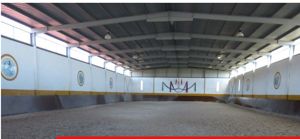
Vista de la pista central del Centro de Equitación "La Cruzada"

Son muy típicas la actuación de las cuadrillas en la misa de gallo del 24 de diciembre, constituidas por hombres y mujeres de todas las edades con instrumentos tales como guitarras, bandurrias, laúdes, panderetas, zambombas, e incluso violines y acordeones, que después de la misa recorrerán el pueblo deteniéndose a la puerta de algunas casas, entonando alguna copla a la vez que piden el aguinaldo.