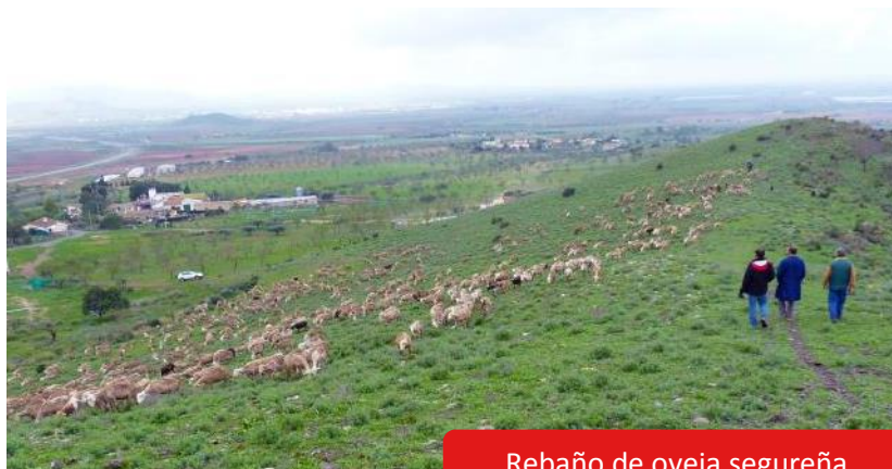
Rebaño de oveja segureña

Las Vías Pecuarias son antiguas rutas o caminos que fueron trazados durante la Edad Media para los desplazamientos de ganado; son por tanto fruto de la trashumancia. La actividad trashumante llegó a mover en la antigüedad a más de cuatro millones de cabezas de ganado, principalmente ovejas, aunque también cabras, vacas, caballos y burros.