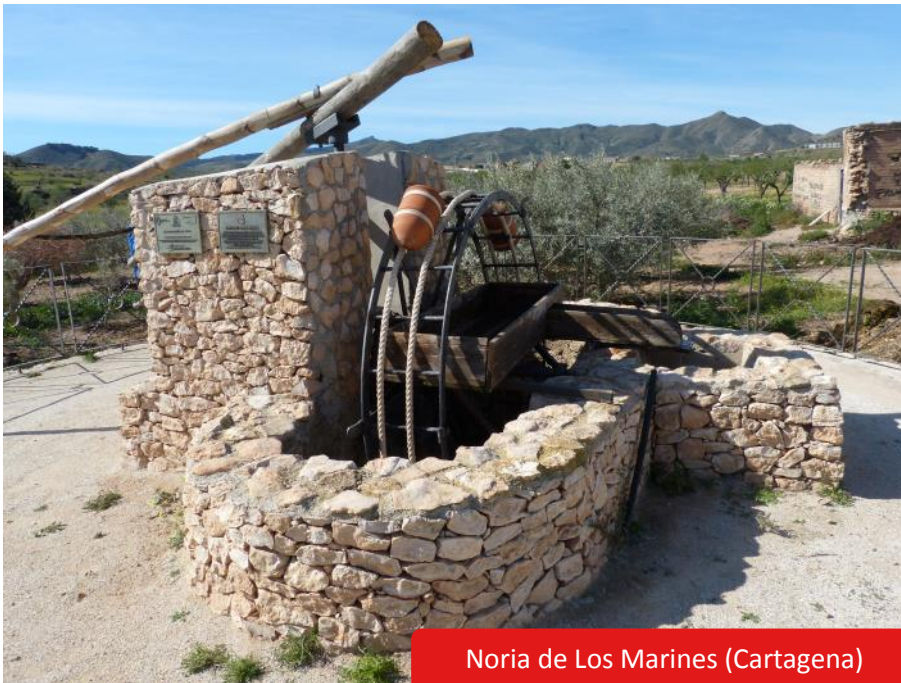
Noria de Los Marines (Cartagena)

La Noria de Los Marines tiene su origen en los años 60 del siglo XX. Inicialmente construida en madera, tras una rotura se reconstruyó con hierro. Se ha empleado durante décadas para la extracción de agua que se usaba en el riego de los cultivos tradicionales de secano de la zona.