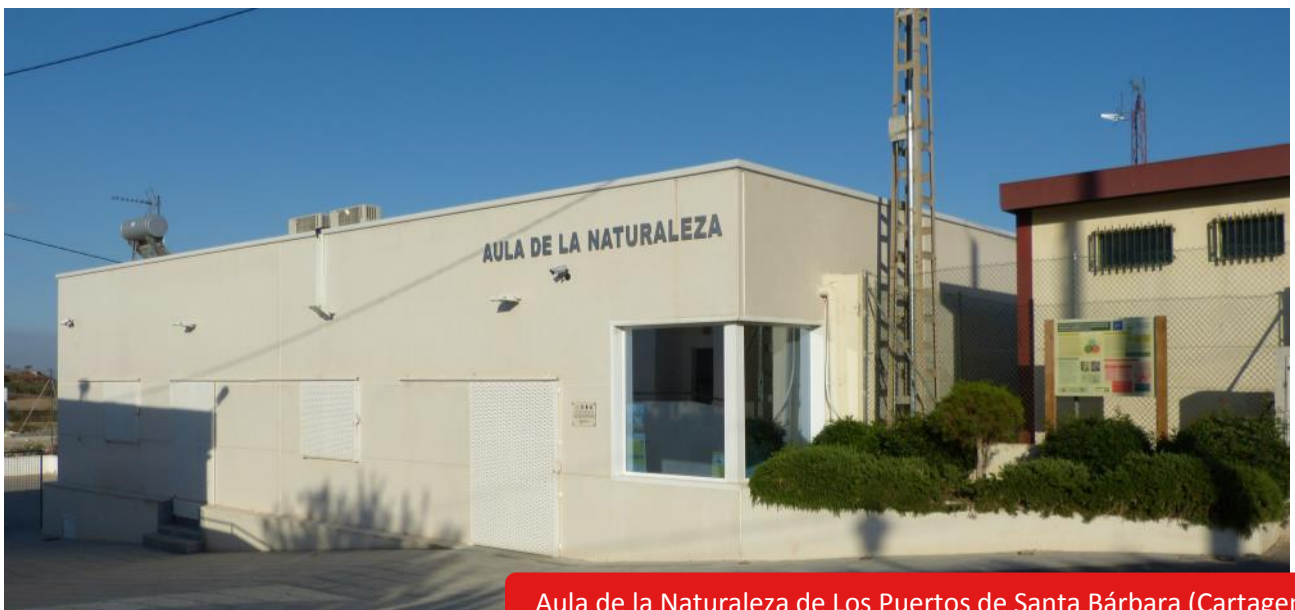
Aula de la Naturaleza de Los Puertos de Santa Bárbara (Cartagena)

Desde aquí se da a conocer a los vecinos la gran riqueza que supone para la biodiversidad de la zona la presencia del Garbancillo de Tallante ( Astragalus nitidiflorus ) en este territorio agroforestal.