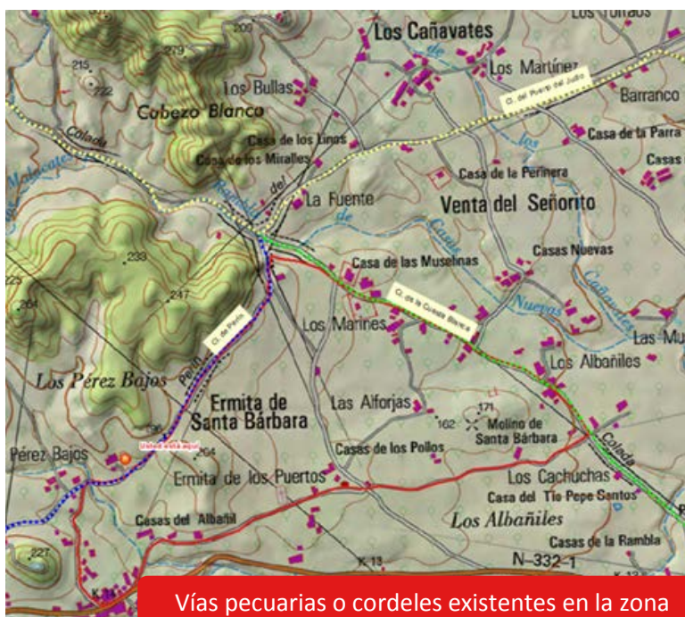
Vías pecuarias o cordeles existentes en la zona

La Red de Vías Pecuarias de Cartagena está constituida por un total de 18 cordeles que suman 197 km de longitud