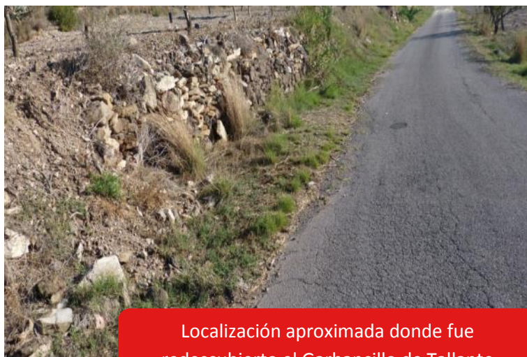
Localización aproximada donde fue redescubierto el Garbancillo de Tallante

El Garbancillo de Tallante ( Astragalus nitidiflorus ) fue descubierta por el botánico Francisco de Paula Jiménez Munuera en el año 1909 y descrita al año siguiente por el botánico Carlos Pau. Desde su descubrimiento únicamente se conservó el pliego recolectado por Jiménez Munuera y una imprecisa descripción acerca su ubicación en el Campo de Cartagena.